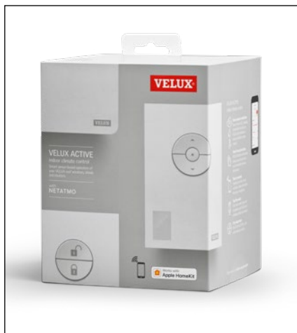
VELUX ACTIVE Starter Pack.